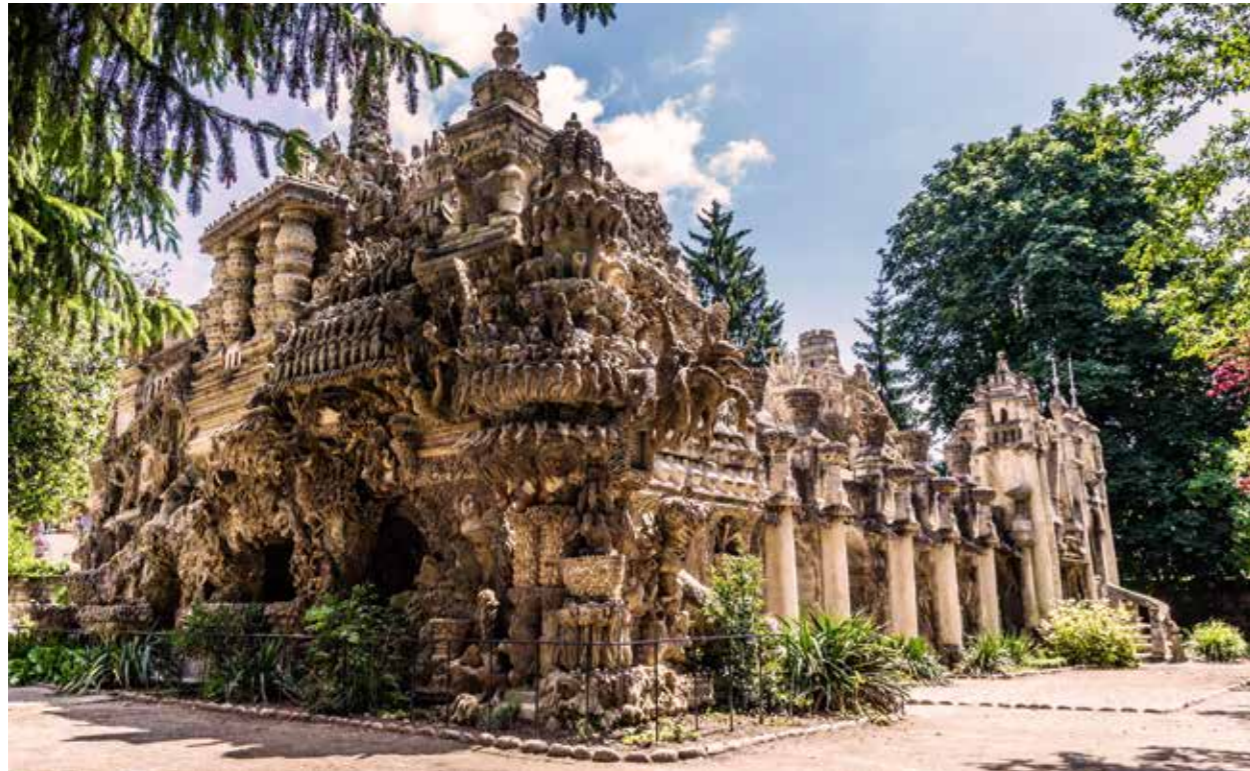
DER PALAIS IDÉAL VON CHEVAL

Die schönste Hängebrücke von Marc Seguin spannt sich zwischen Tournon und dem Nachbarort Tain-l'Hermitage über die Rhône. Tournon ist Frankreich en miniature: Mit einem Schloss, einem feinen Museum, in dem die Geschichte der Grafen von Tournon, die Schifffahrt und die Arbeiten von Seguin thematisiert werden. Und einem botanischen Garten, sehr lauschig! Nicht verpassen darf man auch die Ausstellung in der historischen Schokoladenfabrik von Tain-l'Hermitage, sehr köstlich!