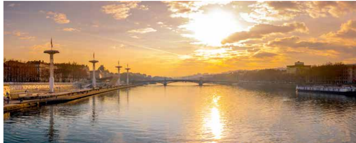
RHÔNEUFER IN LYON

4 TAGE / 3 NÄCHTE – ABFAHRT: AVIGNON / ANKUNFT: LYON