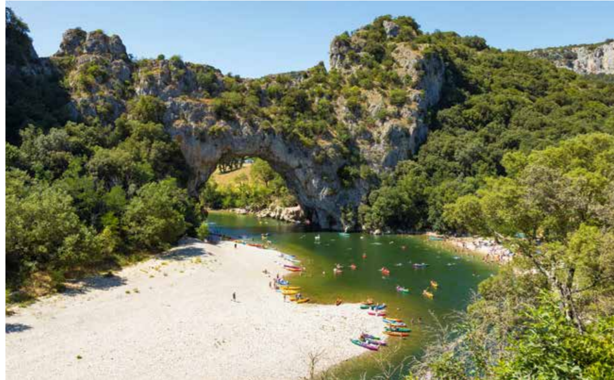
KAYAK-TOUR IN DER ARDÈCHE

Unsere Ausflüge sind besonders. Sie werden Ihnen überraschende und unvergessliche Erlebnisse garantieren. Architekturliebhaber, Kunstkenner, Freunde der Musik, der Natur und des Kulinarischen werden bei unseren Exkursionen neue Erfahrungen sammeln können. Wir haben die Ausflüge dafür im Folgenden inhaltlich und nach dem Schwierigkeitsgrad kategorisiert.