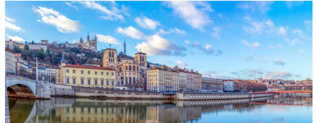
RHÔNEUFER IN LYON

4 TAGE / 3 NÄCHTE – ABFAHRT: LYON / ANKUNFT: LYON