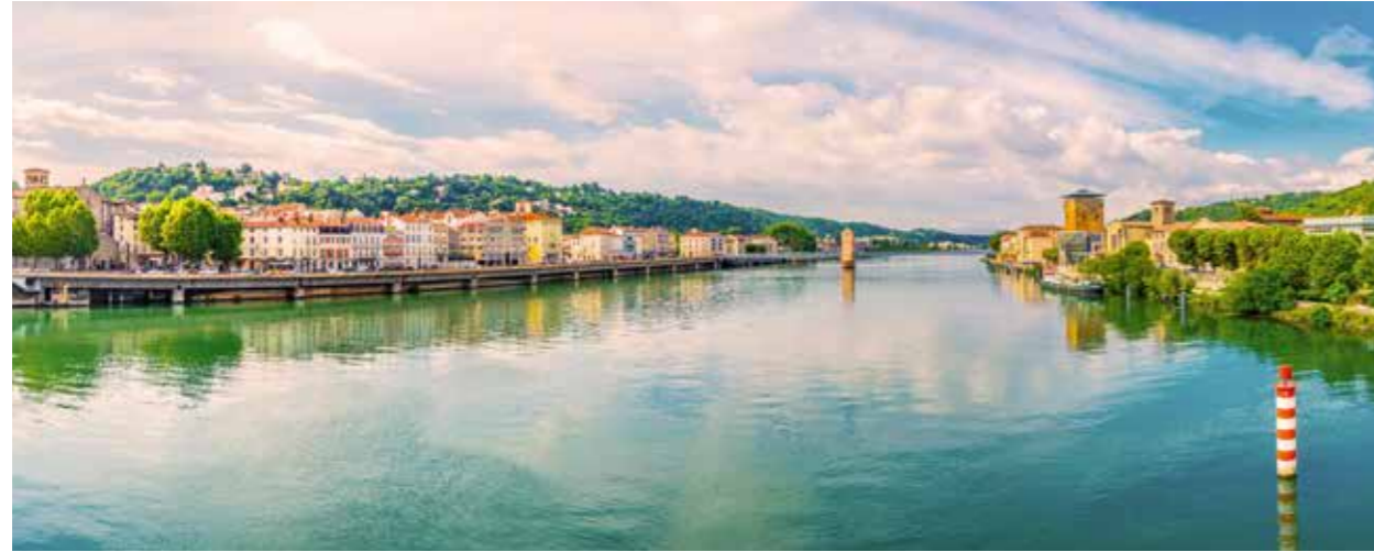
VIENNE AN DER RHÔNE

9 TAGE / 8 NÄCHTE – ABFAHRT: LYON / ANKUNFT: LYON