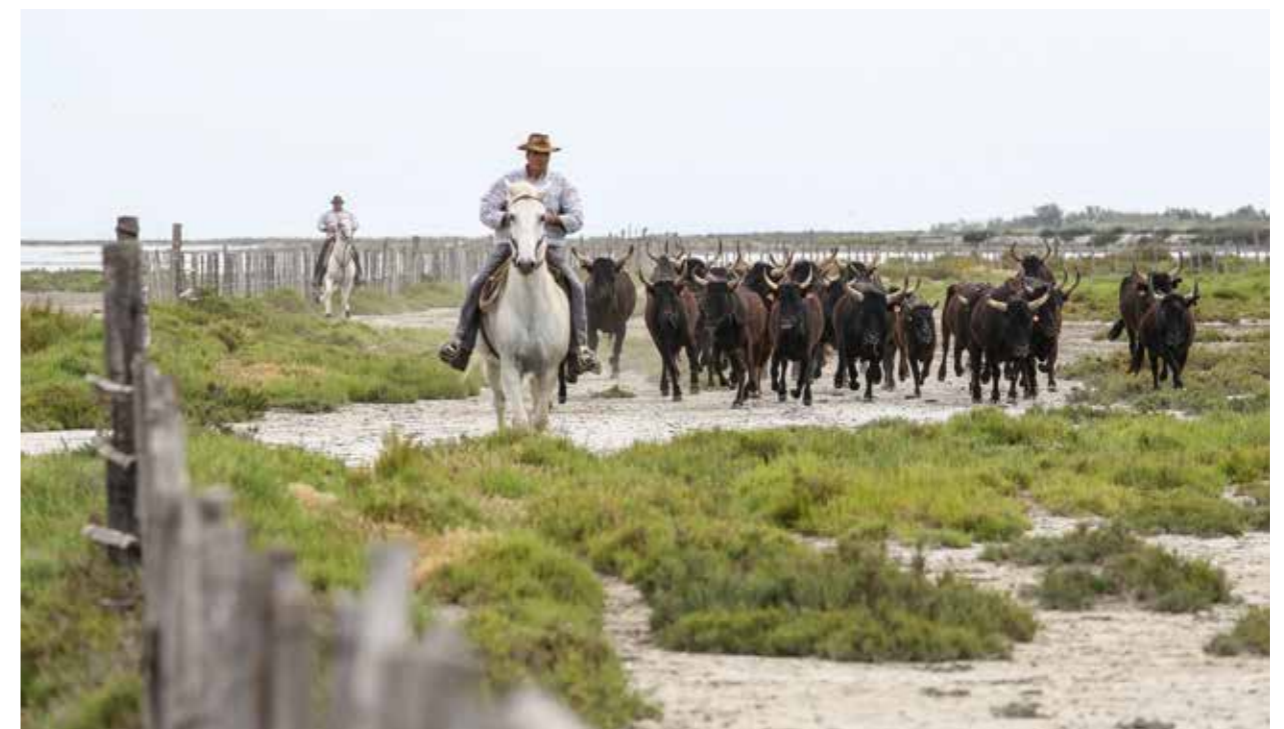
RINDERHIRTEN IN DER CAMARGUE