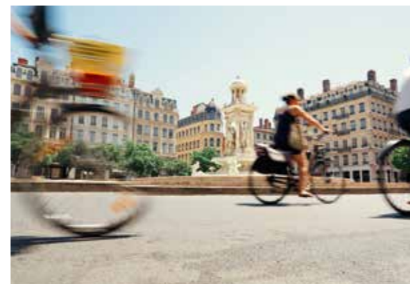
E-BIKE TOUR DURCH LYON