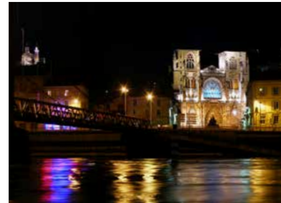
VIENNE BEI NACHT

Diese Stadt ist ein Juwel für Menschen, die sich für das Gestern und das Heute interessieren. Vienne ist Kleinstadt, zählte im 2. Jahrhundert aber bereits 30.000 Einwohner. Einen Aufschwung brachten Handel und die Dampfschiffahrt im 19. Jahrhundert Und was sollte man sehen? Auf jeden Fall das Archäologische Museum, die Museumsanlage Saint-Romain-en-Gal mit dem Haus der Ozeangötter und die Reste der einstigen Thermen. Und danach setzt man sich am besten in ein Café und genießt die Gegenwart.