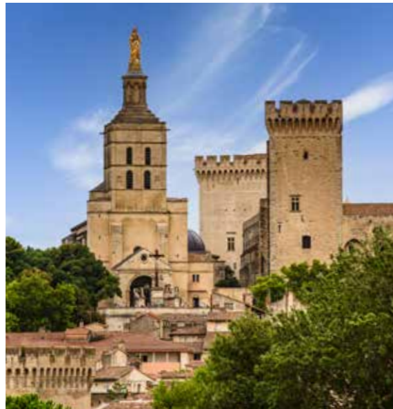
KATHEDRALE UND PALAST DER PÄPSTE IN AVIGNON

Sie ist Wahrzeichen der Stadt. Sie biegt sich über die Rhône und das bereits seit 1840. International bekannt wurde die Pont Saint-Bénézet durch das Lied «Sur le pont d'Avignon». Wer sie überquert steht gleich vor dem Papstpalast, einem der größten und wichtigsten mittelalterlichen Gebäude Europas. Er entstand, man muss es sagen, aus purer Faulheit: Denn der Erzbischof von Bordeaux machte sich nicht die Mühe, zu seiner Papstweihe nach Rom zu reisen. Er ließ sich in Lyon krönen und in Avignon einen Palast bauen. Ein Monument.