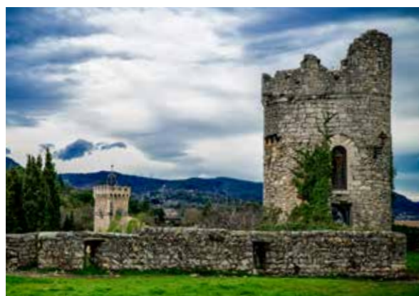
TURM DER STADTFESTUNG IN VIVIERS

Nachts scheinen die Geschichten von den Hauswänden zu flattern. Schmale Gassen. Kopfsteinpflaster. Diese Kleinstadt ist ein Kleinod. Ja, ein Spaziergang durch Viviers ist eine Reise ins Mittelalter, denn die einstige Bischofs-Stadt blieb von der Zerstörung durch Kriege verschont. Neben kleinen Läden gibt es auch Großes zu sehen. Etwa die Kathedrale mit besonderen Kunstwerken wie den fünf Gobelins – drei von ihnen schenkte Napoléon III. dem Bischof. Ein Höhepunkt ist im wahrsten Sinne des Wortes der Aussichtspunkt in der Oberstadt. Was für ein Blick auf diesen zauberhaften Ort.