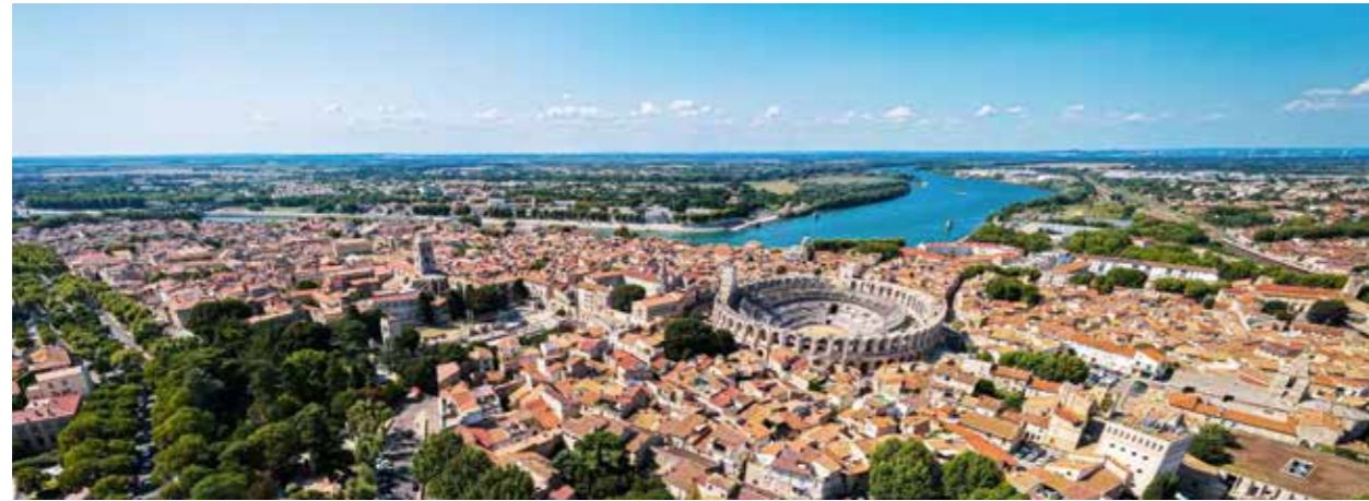
BLICK ÜBER ARLES

Der Sound von Ravels weltbekanntem Stück Boléro ist hinreißend. Ein gleichbleibender Rhythmus, der doch ganz unterschiedlich schöne Stimmungen auslöst. Und so ist es auch mit dieser besonderen Kreuzfahrt. Der Klang der Städte und der Landschaften macht sie unvergesslich. An Bord und an Land werden Sie zwischen Avignon und Lyon viele Momente des Glücks erleben.