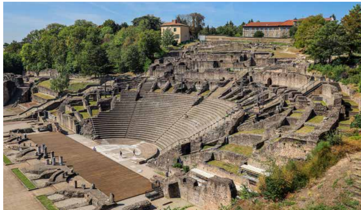
DAS ANTIKE THEATER VON FOURVIÈRE

Auf diesem faszinierenden Rundgang kommen Sie Lyons Highlights ganz nah. Fast 2.000 Jahre alt ist die Stadt – ihre Baudenkmäler zeugen von dieser reichen Geschichte: Römische Ruinen