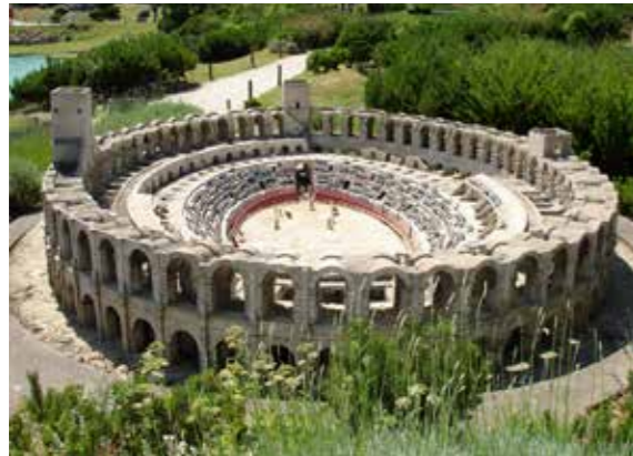
ARENA VON ARLES

Diese Perle der Provence ist umgeben von den schönsten Naturparks in Europa. Arles steht heute als Inbegriff für bedeutende Kunst und Zeugnisse einer ereignisreichen Geschichte, vom Amphitheater bis zu stolzen Patrizierhäusern. Und was wäre Arles ohne van Gogh – im Lichte des Künstlers durch die Stadt flanieren – auch das ist unvergesslich.