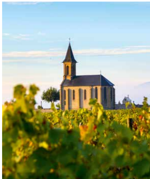
SAINT LAURENT D'OINGT IN BEAUJOLAIS

Ihr Reisebus holt Sie an Ihrem Riverside-Schiff ab zur Panoramafahrt durch das berühmte Weinbaugebiet Beaujolais: sanfte Hügel, üppige Rebberge, charmante Dörfer. Eines der schön-