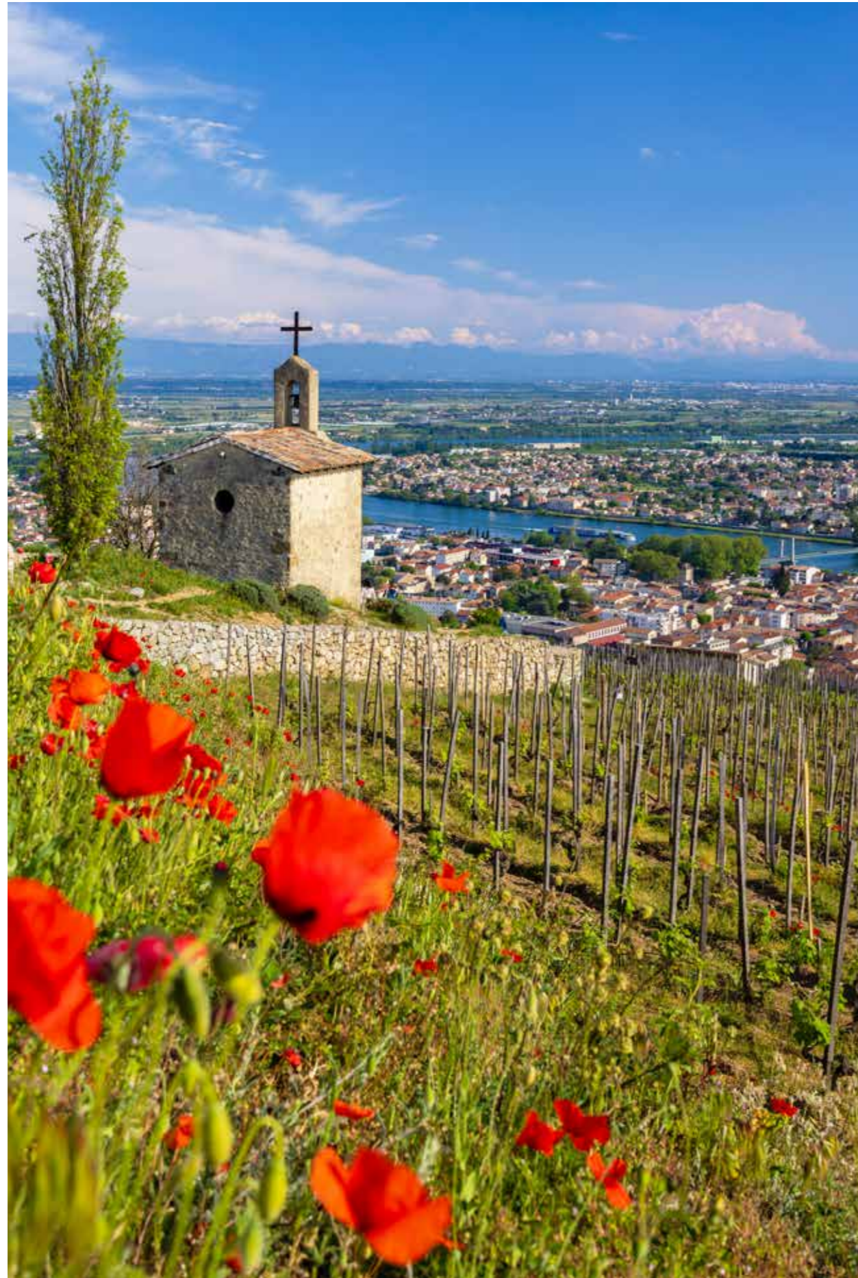
GRAND CRU WEINBERG UND KAPELLE DES HEILIGEN CHRISTOPHORUS IN TAIN L'HERMITAGE MIT BLICK AUF DIE RHÔNE