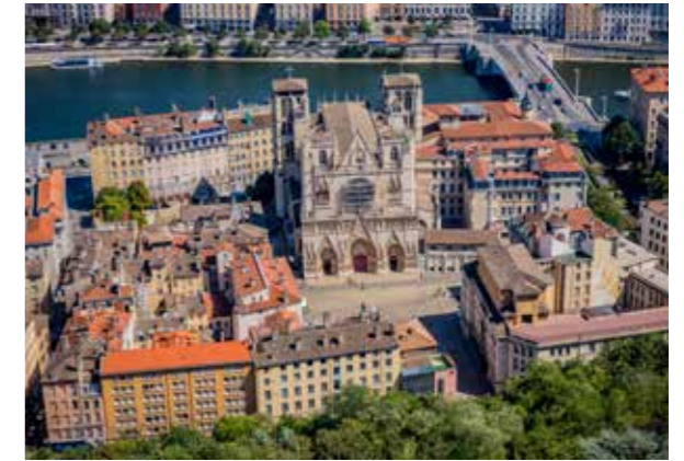
BLICK AUF DIE ALTSTADT VON DER BASILIKA FOURVIÈRE

Ein lokaler Guide führt Sie durch die Galerie der Engel, die beeindruckende Wendeltreppe, hinauf auf den Glockenturm und die Michaels-Terrasse. Sie besteigen gemeinsam das Dach und genießen von dort oben einen einmaligen