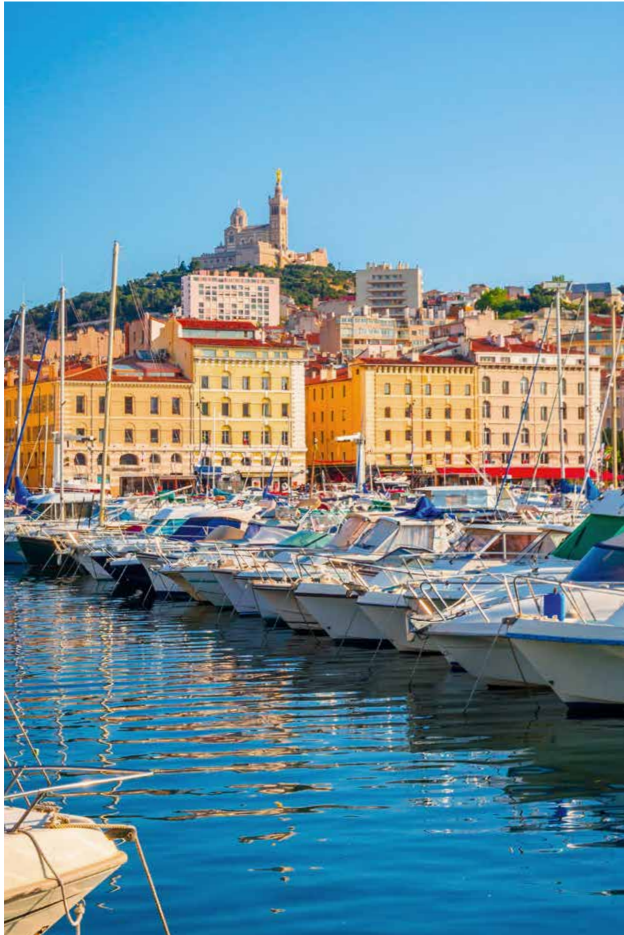
DER HAFEN VON MARSEILLE MIT BLICK AUF DIE NOTRE-DAME DE LA GARDE