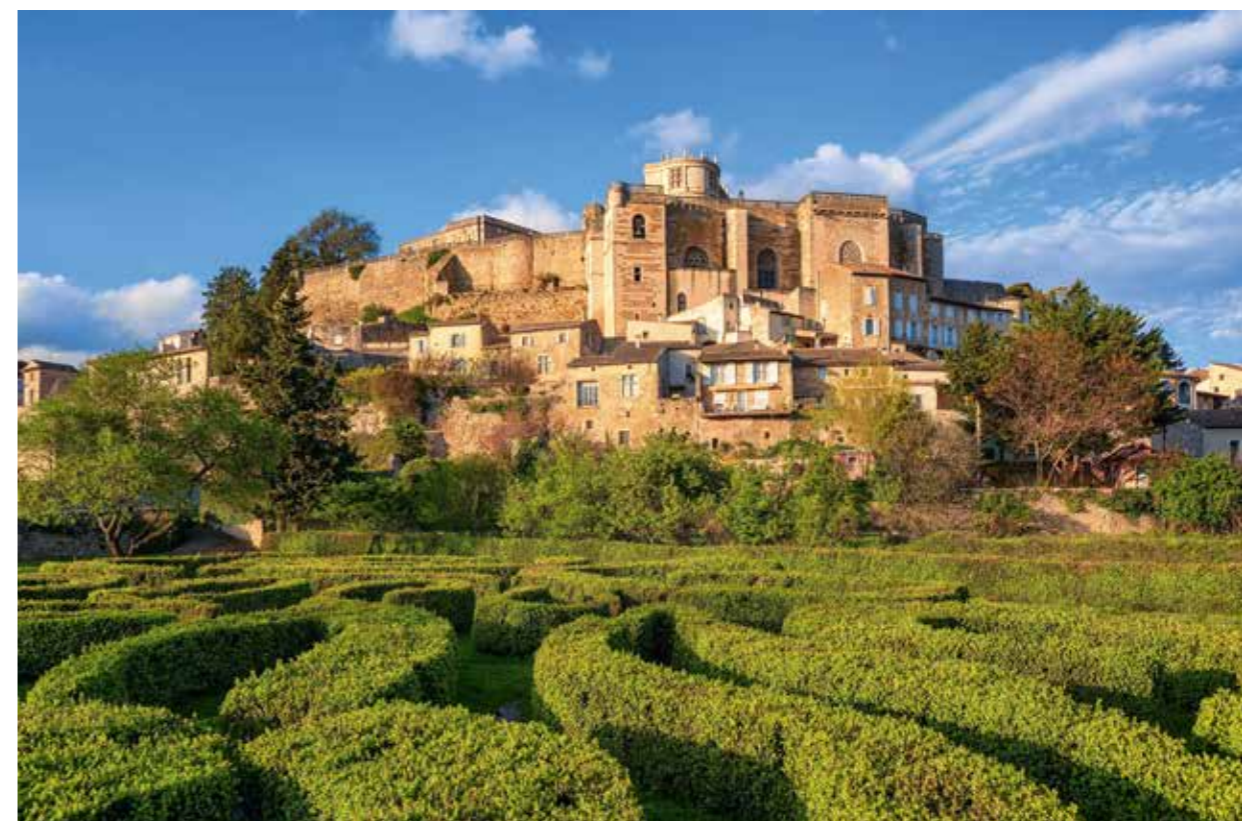
CHÂTEAU DE GRIGNAN

TASTE Dauer: 4,5h Schwierigkeit: moderat