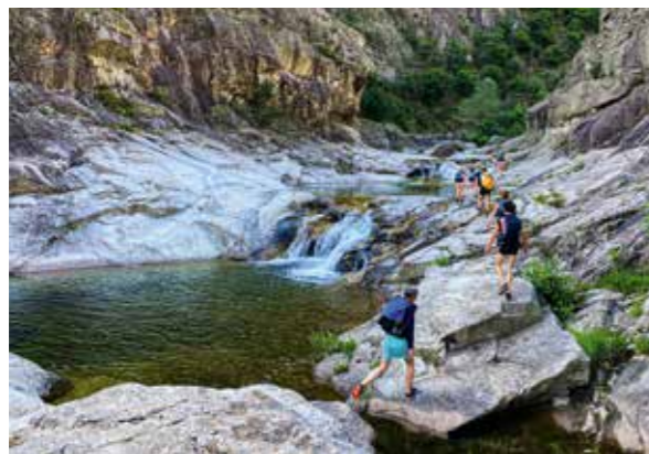
WANDERUNG IN DER ARDÈCHE

ACTIVE Dauer: 4,5h Schwierigkeit: anspruchsvoll